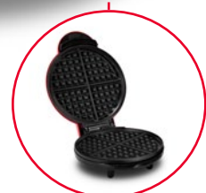
Cooking Surface Superficie de cocción Surface de Cuisson

----- Inside / Behind Adentro / Detrás À l'intérieur / Derrière