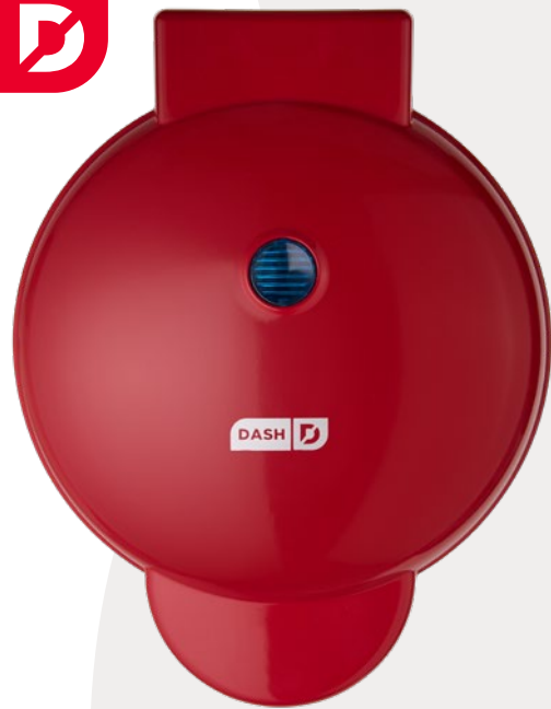
8" EXPRESS WAFFLE MAKER WAFLERA DE 8" (20CM) GAUFRIER 8" PO (20CM)